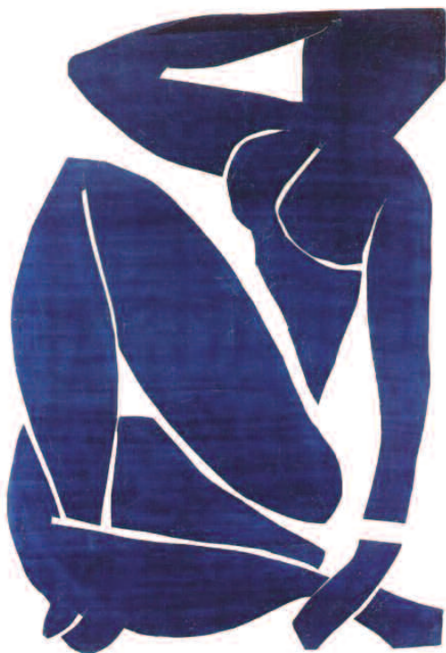
4447-04 52 Nudo blu III di Henry Matisse