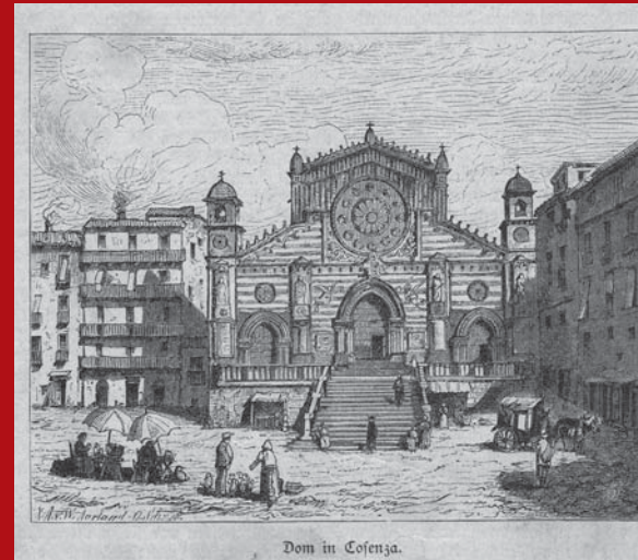
Dom in Cosenza.